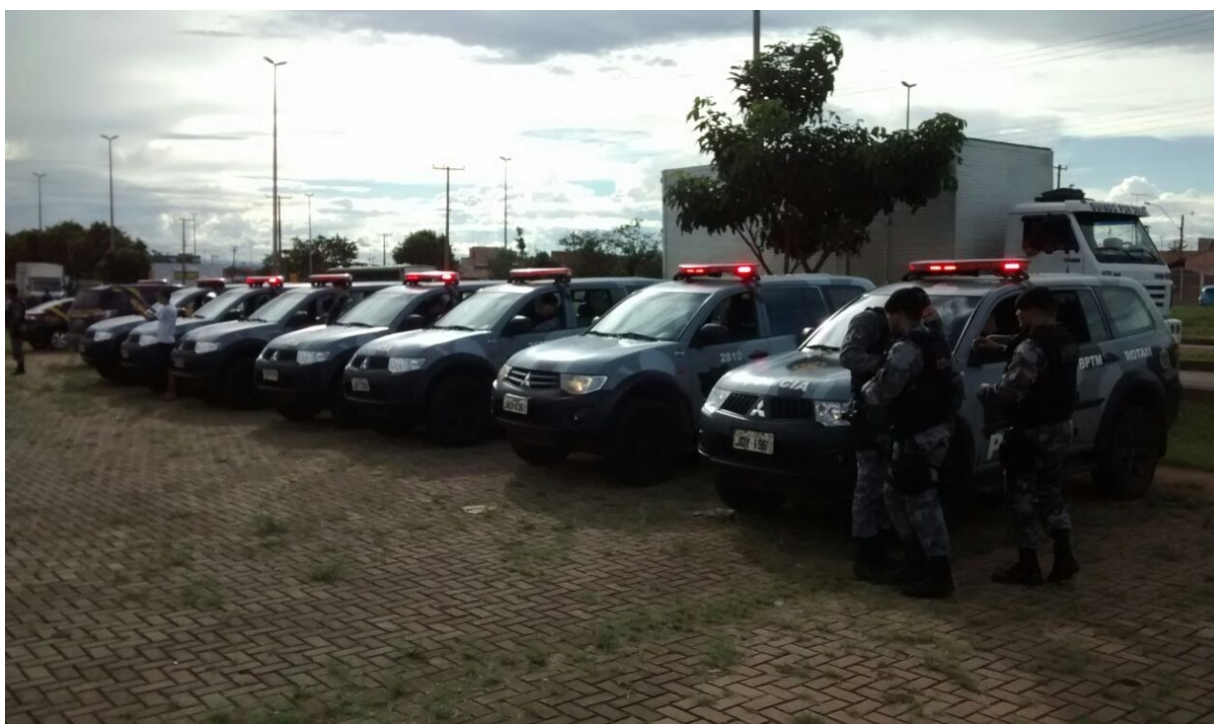
Apoio da Rotam ao Programa Comando nas Ruas