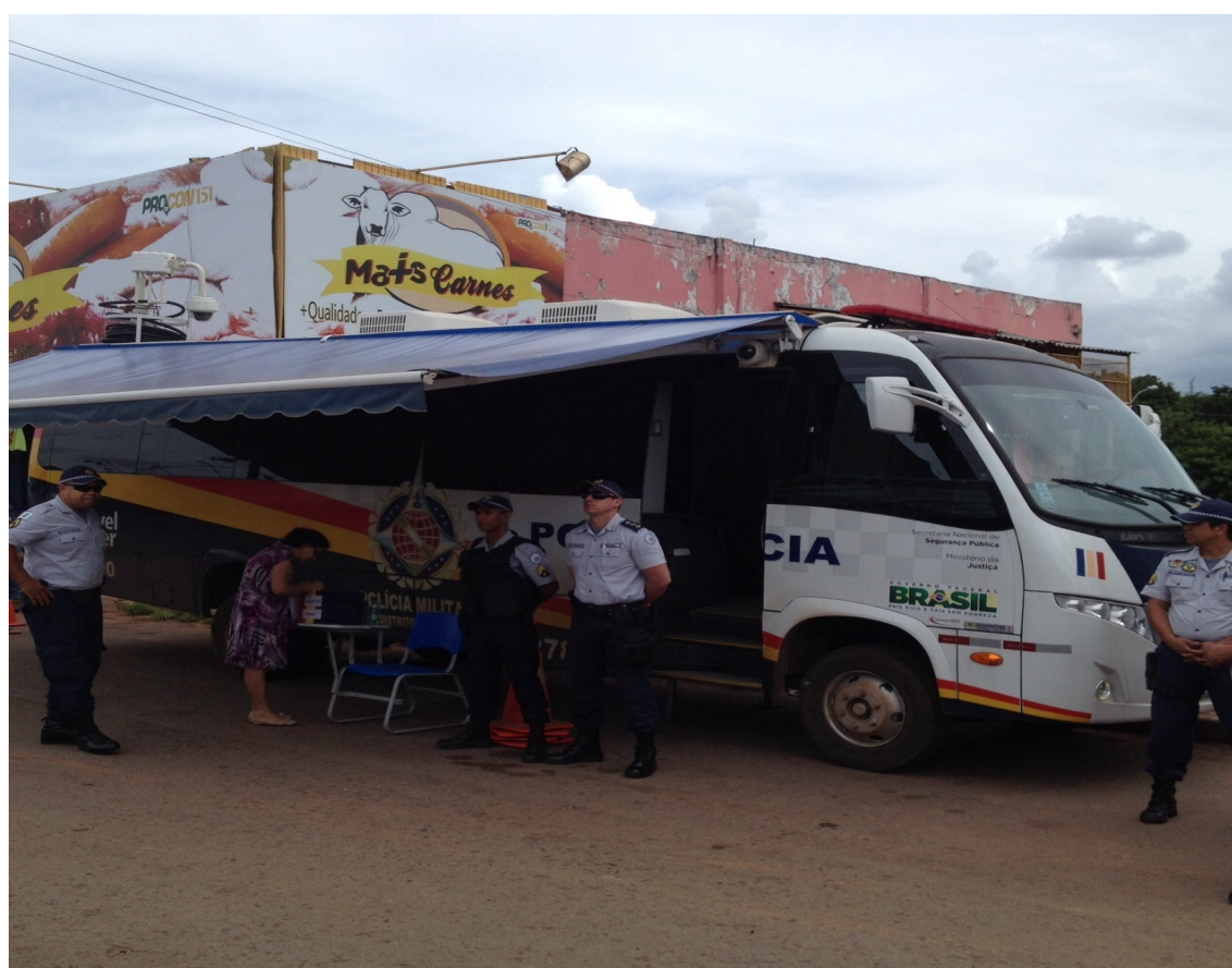
Caixa de sugestões: A comunidade como parceira do Programa

"Brasília – Patrimônio Cultural da Humanidade"