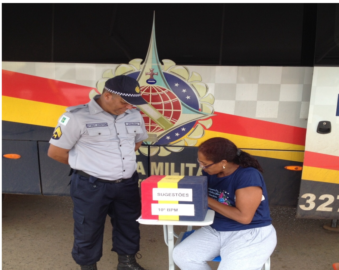
Comunidade participando com suas sugestões